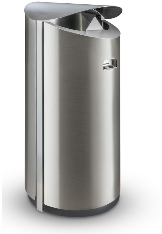
Abfallbehälter HERKULES 110 L mit Einwurfsverengung und Türascher