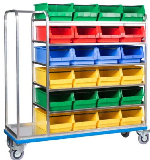
Sichtlagerkästen nicht im Lieferumfang enthalten