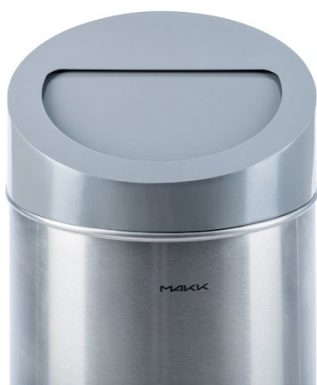
Capot avec trappe de dépôt, fermeture automatique par contrepoids pour le modèle 60