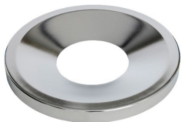
Entonnoir électropoli, 60 ou 110 L