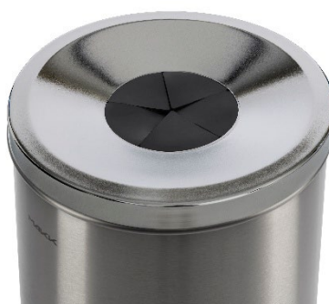
Entonnoir avec lèvres en caoutchouc pour corbeille 110 L