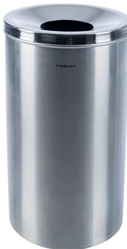
CESTO corbeille 110 L, en pose libre