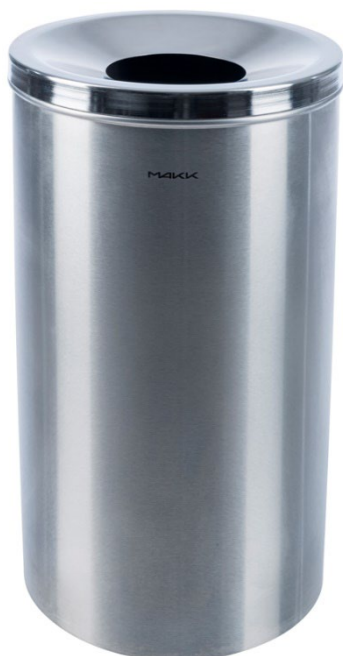
CESTO corbeille 60 L, poubelle murale