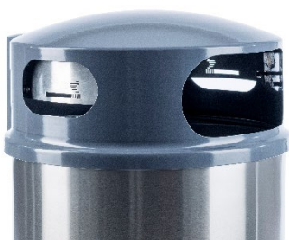
Capot avec deux cendriers latéraux