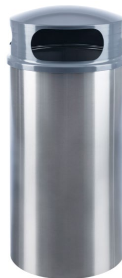
Corbeille à déchets GOLIATH en pose libre