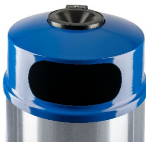
Capot avec cendrier supérieur verrouillable