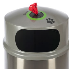
Capot avec compartiment pour sacs de déjections canines