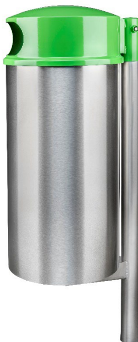
Corbeille à déchets GOLIATH avec support à sceller